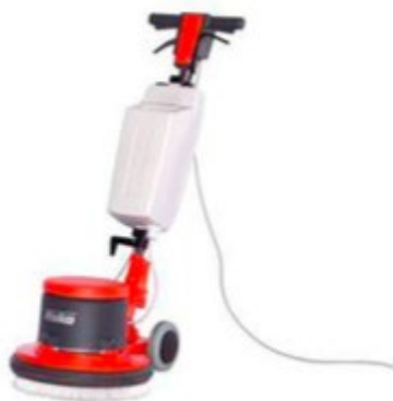
Bodenreinigungsmaschine mit rotierendem Drehkopf